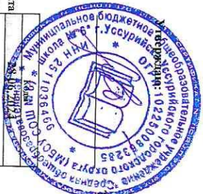
Раздел 1. Поступления и выплаты